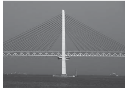
横浜ベイブリッジ

会期 2018年3月9日(金)ー2018年4月25日(水) 会場 ギャラリーエークウッド(東京都江東区新砂1-1-1)／入場無料 開館 10:00-18:00(最終日は17:00まで)／日・祝休館