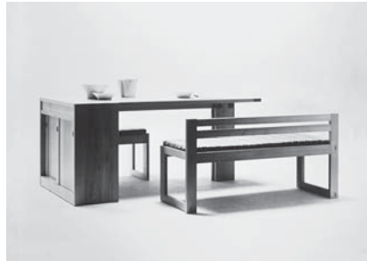
ひのきダイニング